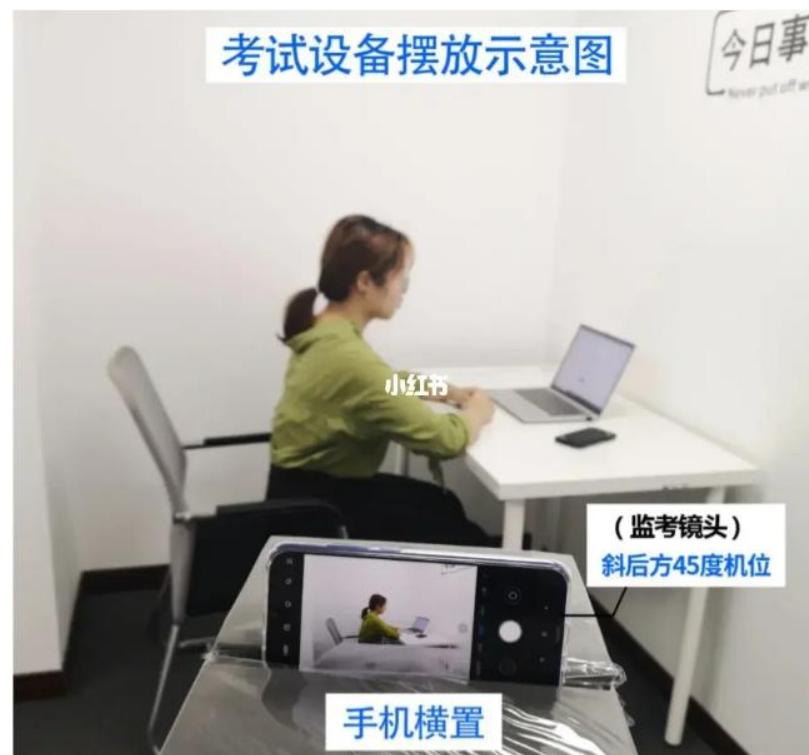
图 1 监考手机摆放位置

(3) 软件环境：电脑须安装谷歌浏览器或 360 浏览器（考前务必进行使用浏览器登录洛谷比赛网站进行测试）。电脑须安装录屏软件（如：oCam 等）进行考试过程的全程录制，并在比赛后上传到网盘，并向组委会提供比赛过程视频的网址。